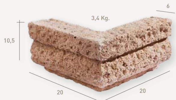
Esquina saliente Tosquera