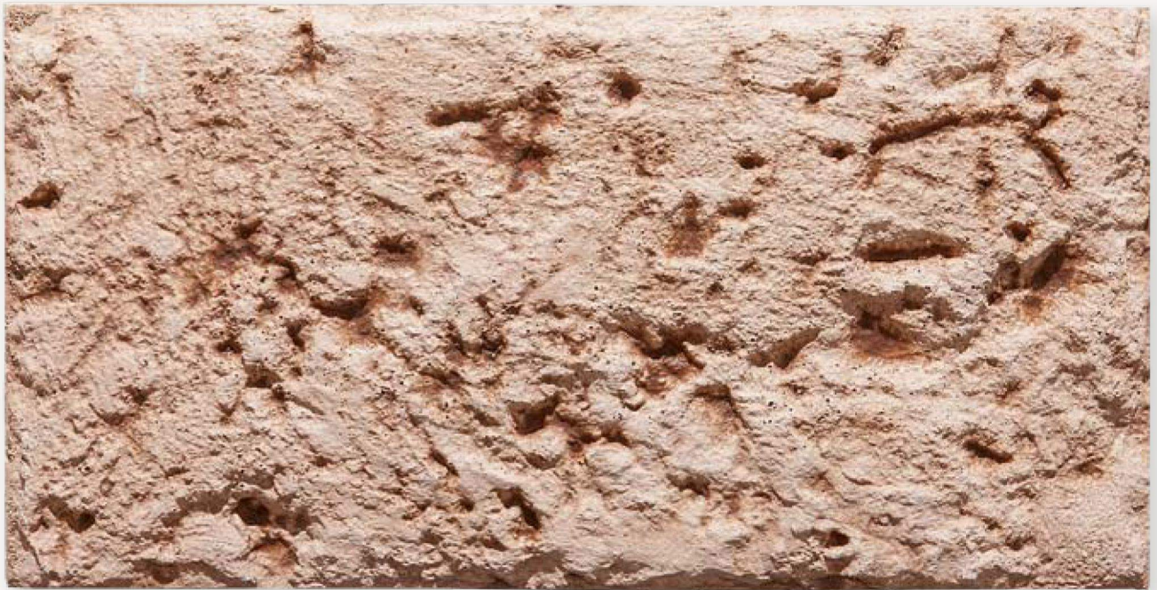
Placa Tosquera 58 x 28,5 cm