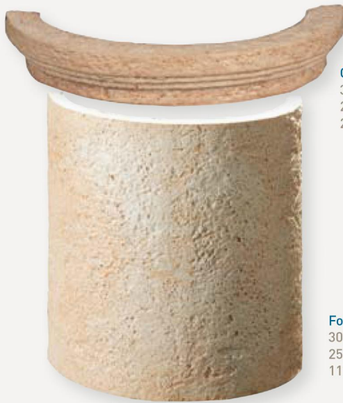
Capitel Mérida 30 cm Ø 25 cm Ø 2,5 Kg.